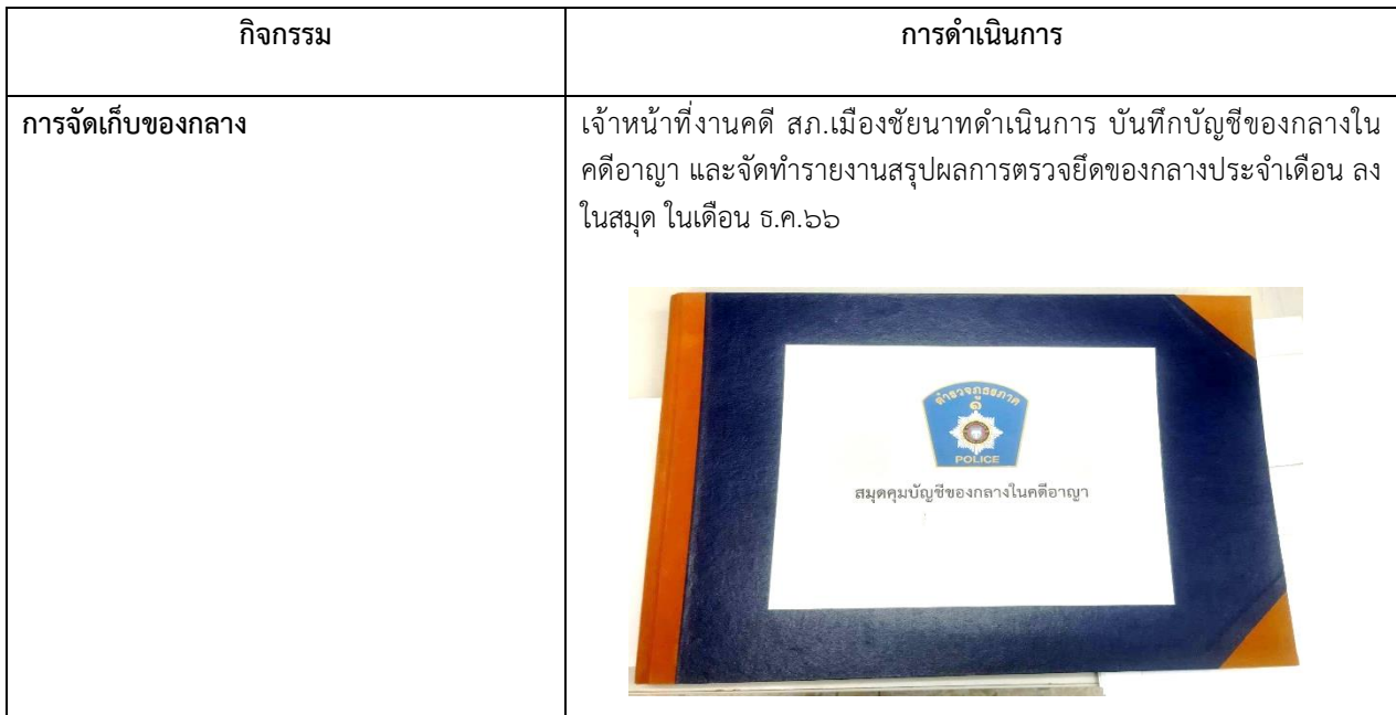
ภาพแสดงผลการดำเนินการ